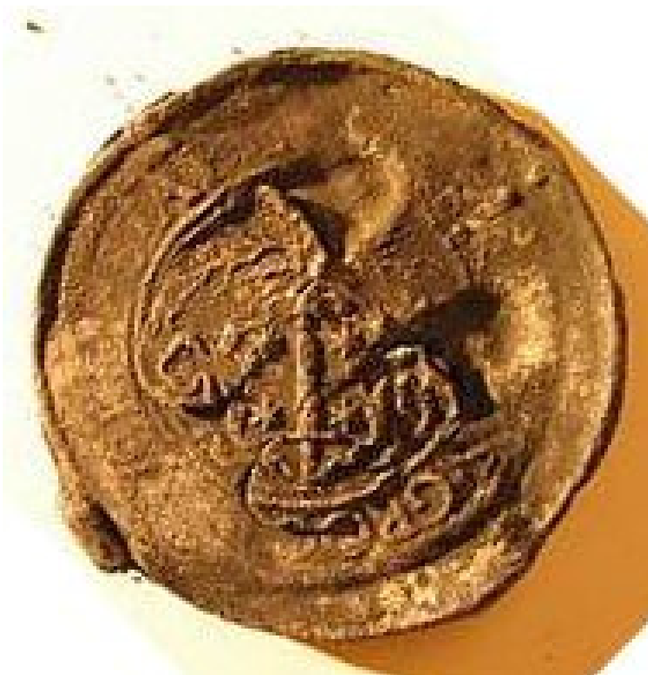
Den anden side af klædeplomben.