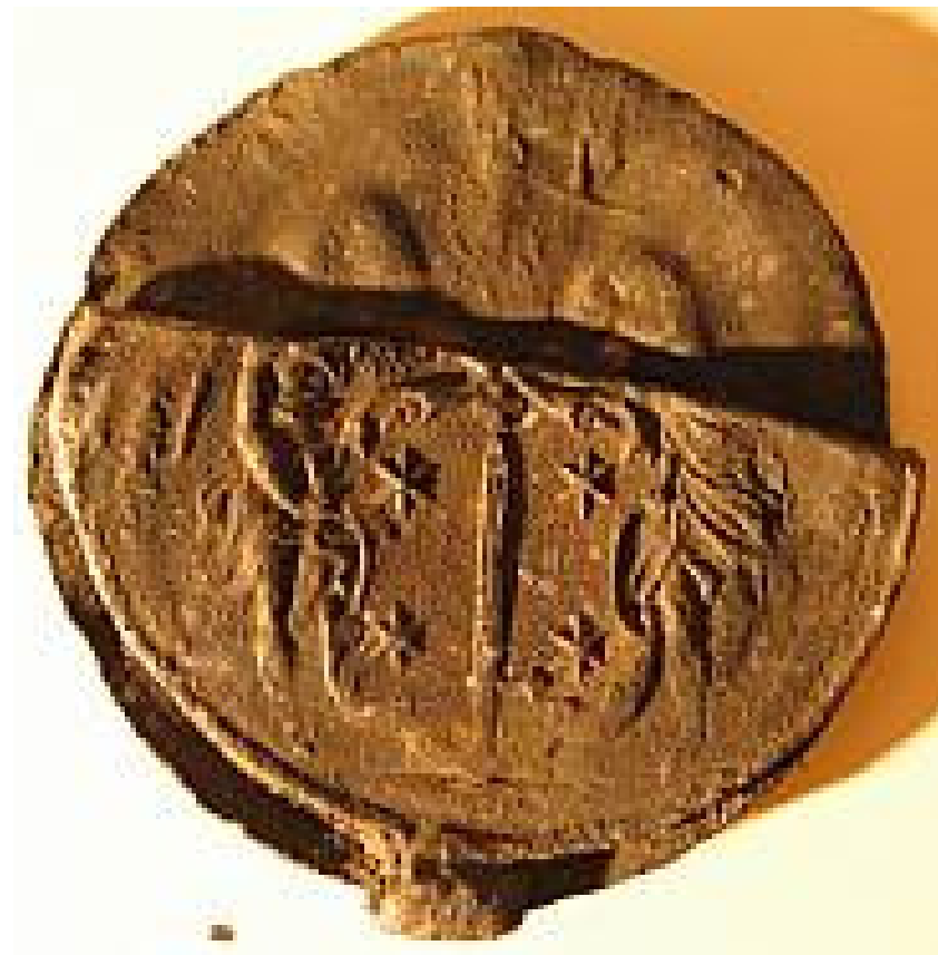
Klædeplomben af bly fra udgravningen i Kolding

Under udgravning af den tidligere slotsmøllegrund i Kolding i det sydlige Jylland, er der fundet en klædeplombe af bly præget med stort set identiske våbenskjolde på begge sider. Museet på Koldinghus bad i den forbindelse om hjælp med identificeringen af våbenet via deres hjemmeside, og en mulig identifikation er at våbenet er, at det drejer sig om den nederlandske by Haarlems våben.