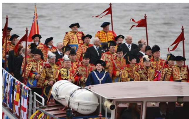
Engelske, skotske og canadiske herolde på Themsen.