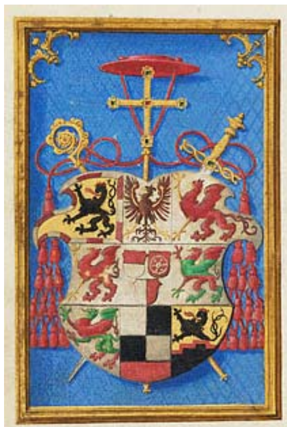
Simon Bening illumination av vapnet