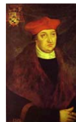
Lucas Cranachs porträtt

Den intresserade kan här närmare studera de intrikata heraldiska skillnaderna.