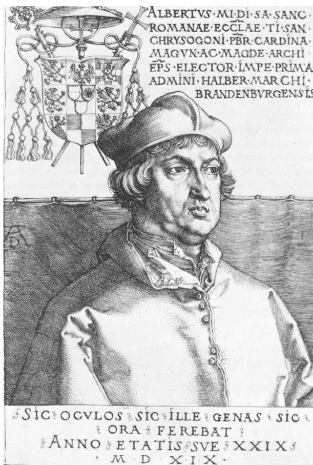
A. Dürers porträtt av kardinal Albrecht