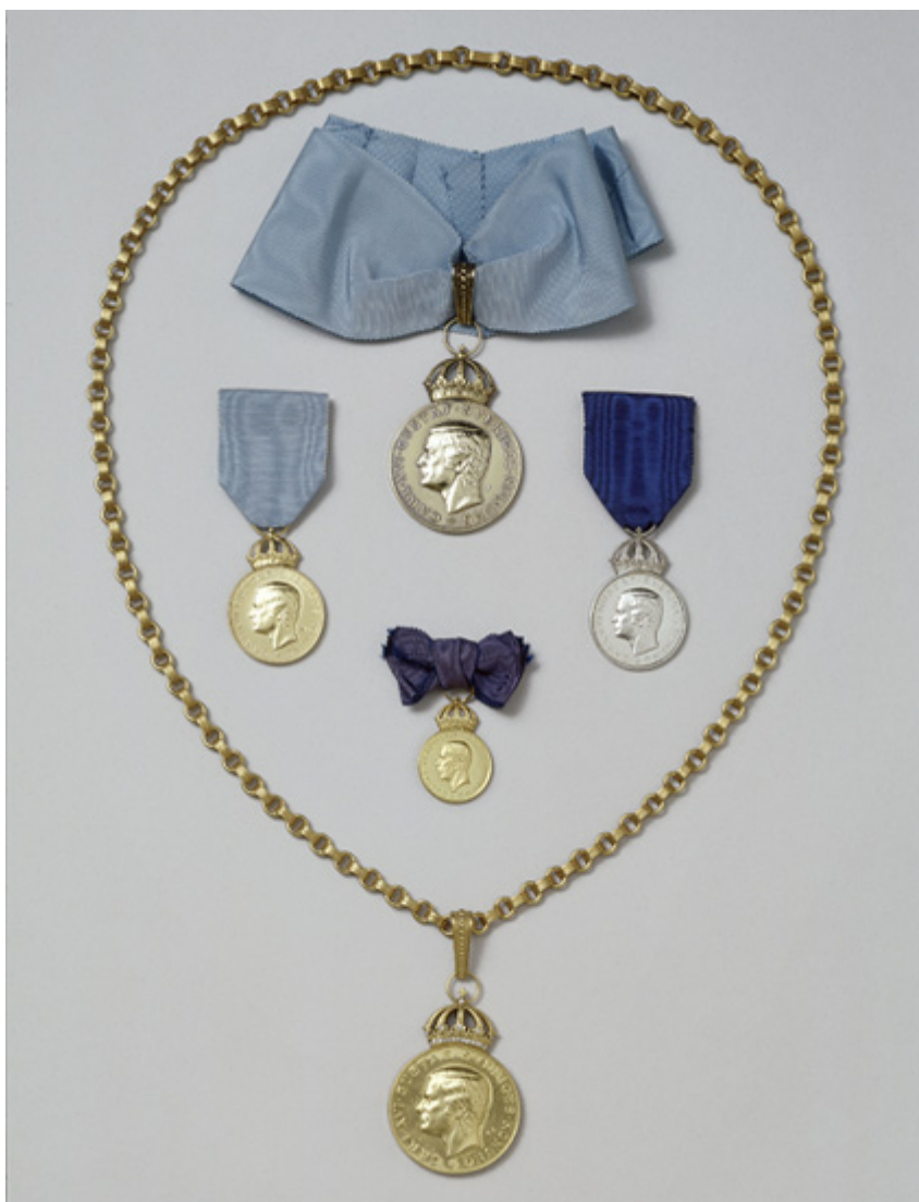
H.M. Konungens medalj, tidigare benämnd Hovmedaljen, medalj instiftad omkring 1814, ursprungligen för belöning av lägre befattningshavare vid hovstaten.

Presidentskapet i Svea hovrätt anses vara det "finaste" juristjobbet i Sverige – t.o.m. bättre än justitieråd. Mycket riktigt har också alla