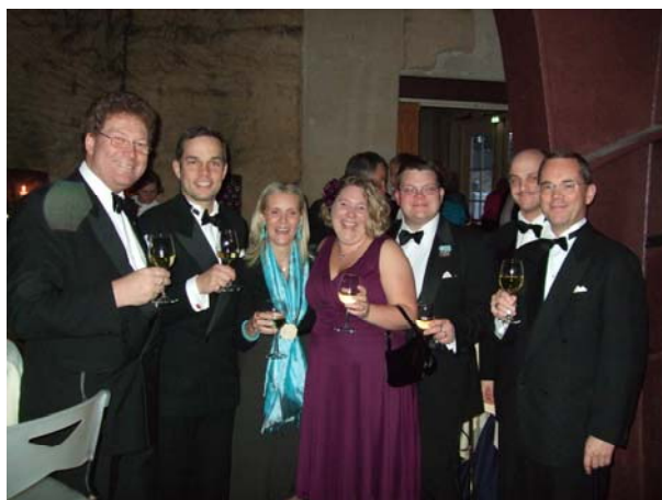
Blomman av nordisk heraldisk "ungdom" inför avslutningsbanketten.