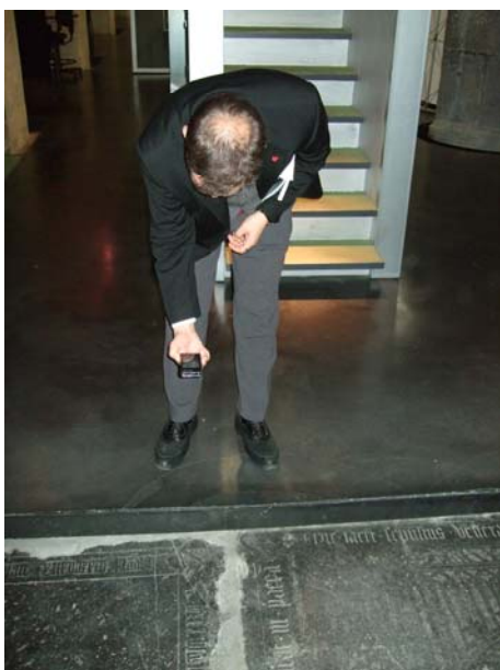
En heraldiker på fältarbete.