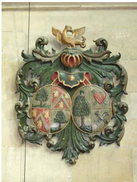
Ett alliansvapen i Maastrichts St. Janskerk.