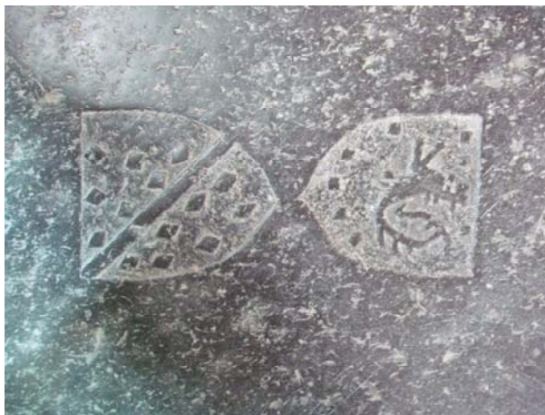
Det oväntade vapenfyndet till vänster rubricerades efter en kort diskussion som "ur-Mannerheim".

Av övriga föredrag kan nämnas Elisabeth Roads som med överlägsen kännedom till sitt ämne talade om Frontiers in