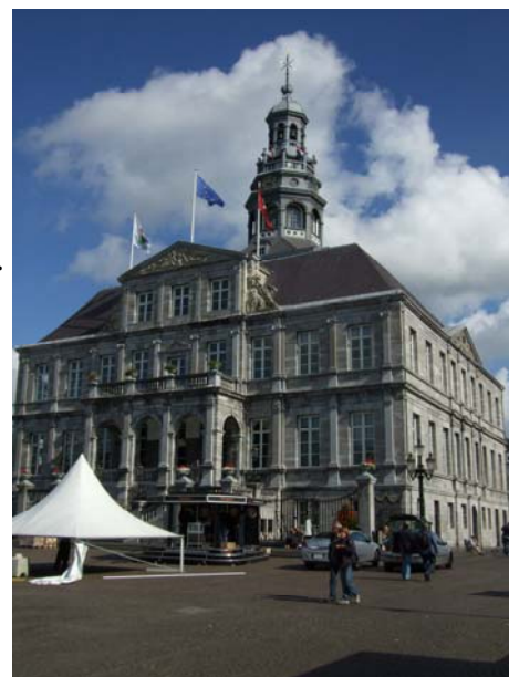
Maastrichts rådhus där borgmästaren höll mottagning för kongressdeltagarna.