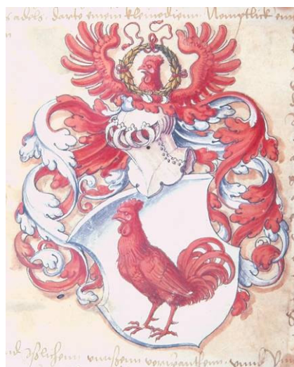
Billeder fra Adels- og våbenbreve udstedt af danske (unions-)konger indtil 1536.