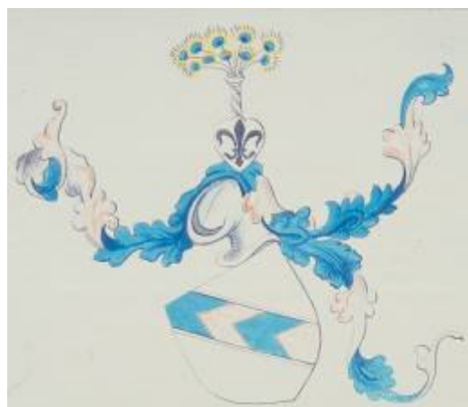
Billeder fra Adels- og våbenbreve udstedt af danske (unions-)konger indtil 1536.