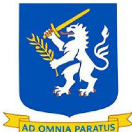
Våbenet med den kastrede løve.