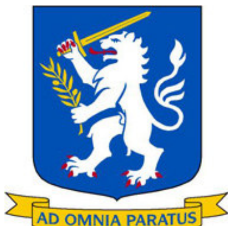
Det originale våben. Tegnet af Vladimir A. Sagerlund, Riksarkivet.