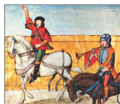
Herolden med sin assistent. Udsnit fra »Kong Renés turnerbog«, o. 1460.

Heraldikken møder vi ikke kun på krigerens skjold som seglmærke, men endvidere på bygnings-tavler på vore gamle herregårde, på ambassadeskilte og skilte ved kommune-grænser, som dekora-tion på porcelæn, som bogejermærker og på mange andre bygninger og genstande.