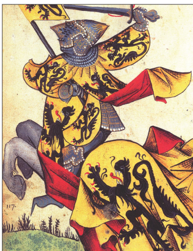
Greven af Flandern. Fra Armorial de la Toison d'Or, »Den Gyldne Flies' Våbenbog«, 1400-tallets første halvdel.

Heraldisk Selskab – Heraldinen Seura – Skjaldfræðafélagid Heraldisk Selskap – Heraldiska Sällskapet