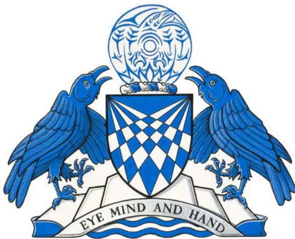
Emily Carr University of Art and Design