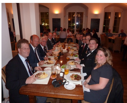
Nogle af de nordiske deltagere - og en enkelt brite - nyder nogle af Stuttgarts kulinariske fristelser.