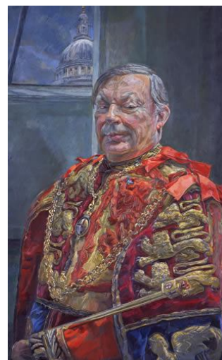
Sir Peter Gwynn-Jones, portræt malet af Daphne Todd. Nedenfor Gwynn-Jones' våben.

http://lordsoftheblog.net/2010/08/24/sir-peter-gwynn-jones/