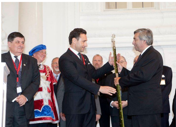
Åbningen af kongressen i Neues Schloss.