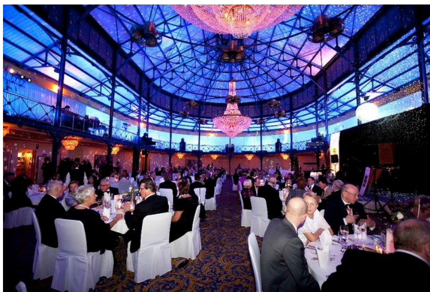
Alte Reithalle, hvor gallamiddagen blev afholdt.