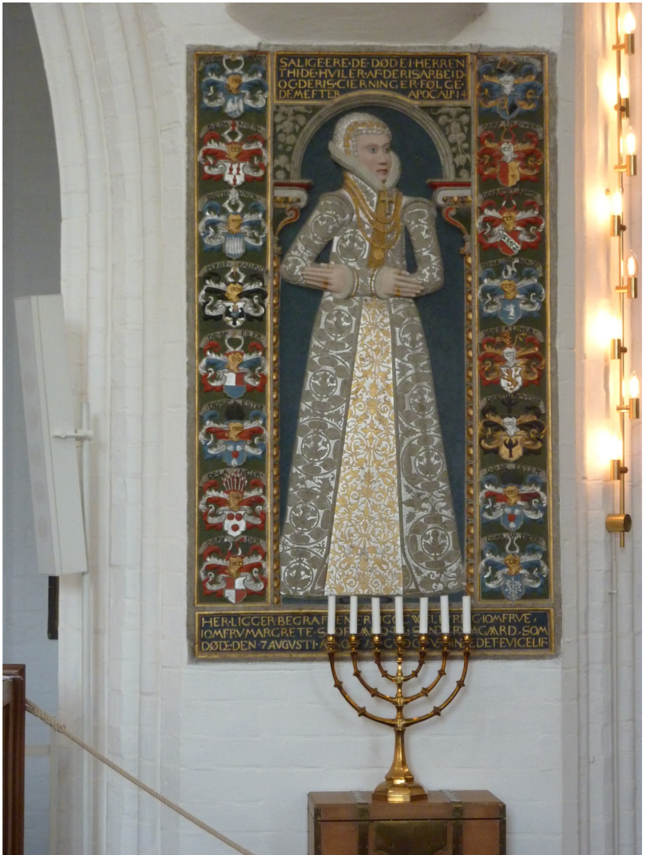
Der er meget andet at se i Skt. Knuds Kirke af heraldisk interesse, bl.a. det imponerende gravkapel over Ahlefeldt-slægten. Gennem årene er især hjelmtegn fra de udhuggede våbener faldet af, og de udstilles i en lille montre.