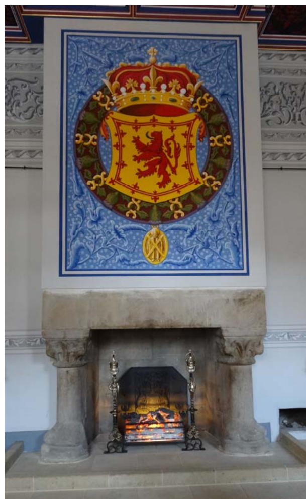
Det skotske kongevåben omgivet af Tidselsordenen, Stirling Castle.