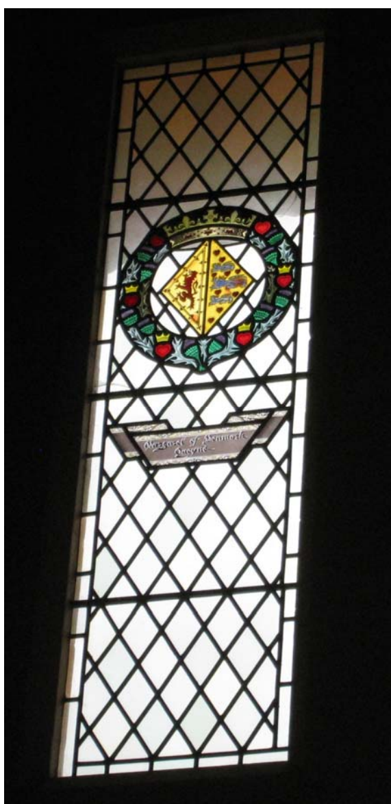
Heraldisk minde om Jakob III af Skotland og hans dronning Margrete, datter af den nordiske unionskonge Christian I.