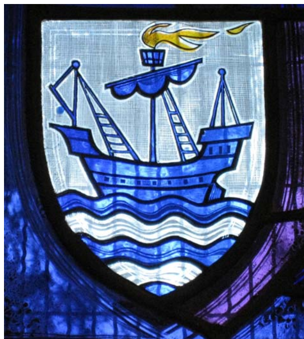
Helsingørs våben. Glasmaleri i Church of the Holy Rude i Stirling, hvor Jakob VI blev kronet som barn i 1567.