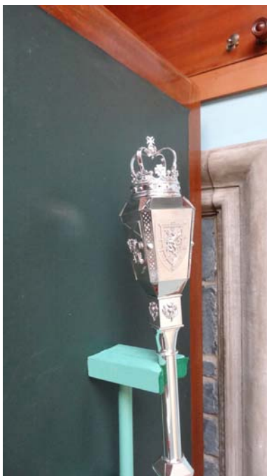
Scepter med Skotlands kongekrone, våben og tidsel. Bæres foran Lord Lyon i processioner. (Billedet er vendt, så våbnet kan ses bedre. –red.).

På kollokviets sidste dag aflagde deltagerne besøg på det imponerende Stirling Castle, der næsten fremtræder som nyt efter en grundig restaurering med genskabte pragtfulde interiører med en mængde heraldik. Maria Stuart blev født og kronet her som spæd i 1543, og hendes søn Jakob VI voksede op på slottet. Han blev senere gift med Christian IVs søster Anna, og i 1603 blev de tillige kongepar i England. Derefter kørte man til Deanston Distillery og så på whisky-fremstilling med mulighed for smagsprøver. Turen fortsatte til Dunblane Cathedral med interessant heraldik. En betagende køretur gennem landskabet The