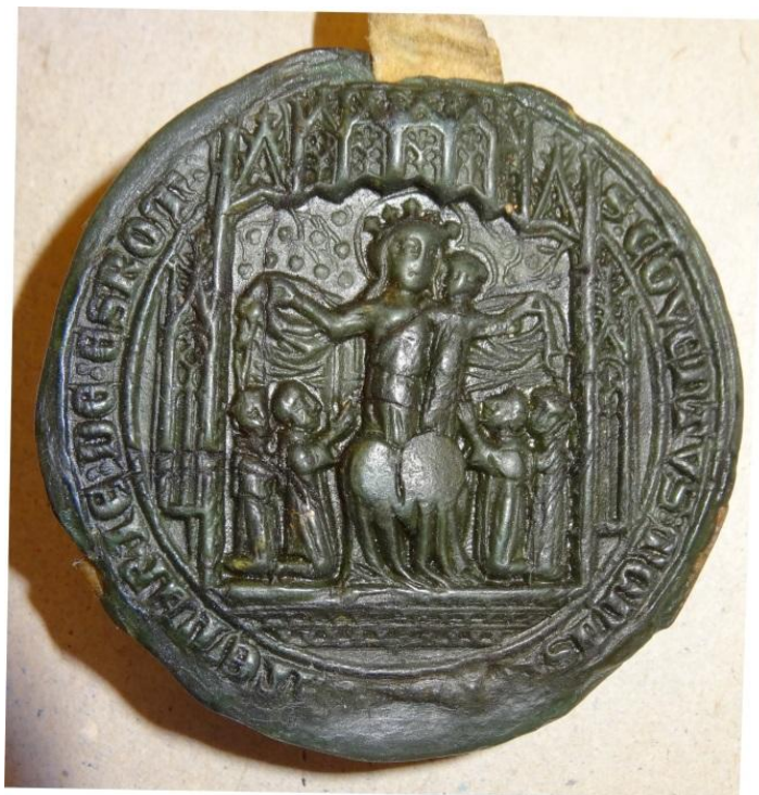
Esum Kloster. Konventssegl, 1374.