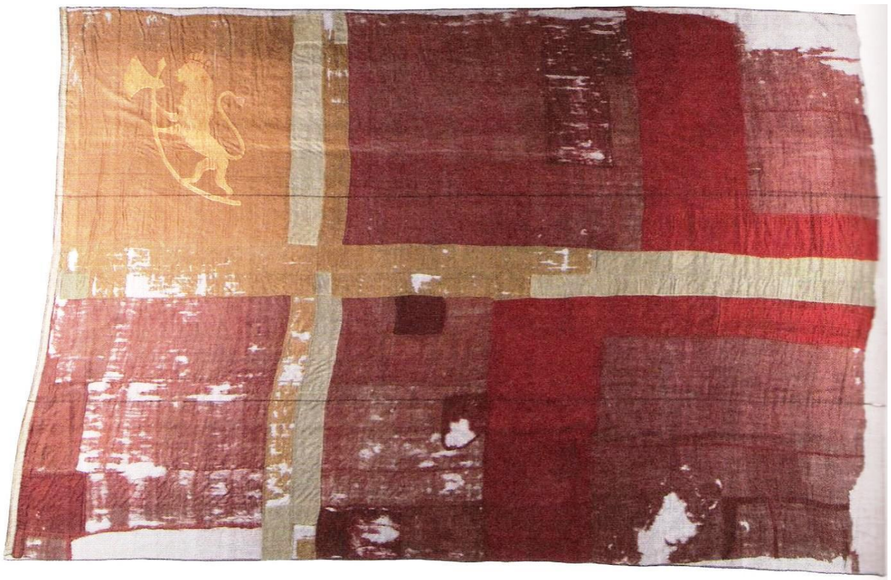
Løveflaget på Eidsvoll