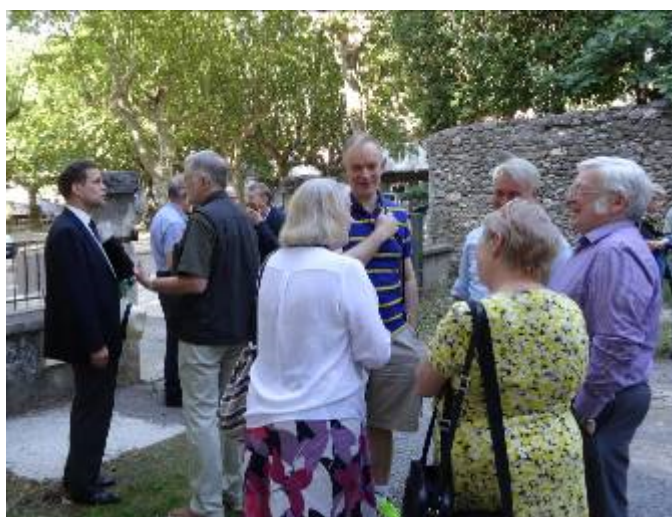
Glimtar och mingel i Saint-Jean du Gard