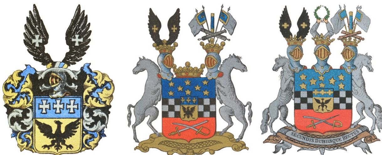
Adelige, friherrelige och grevelige familier Adlercreutz