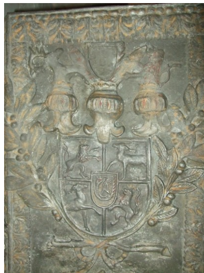
Pommern-Wolgast (hertig Friedrich av Kurland) & (hertig Jakob av Kurland)

Hertig Freidrich följdes år 1642 av sin brorson hertig Jakob (1610-1681). Också hans sarkofag är gjord av tenn, har rika förgyllda dekorationer av krigstrofeer, palmetter och lagerkvistar och smyckas sjävfallet av hertigvapnet. I hjärtskölden ses två kronor.