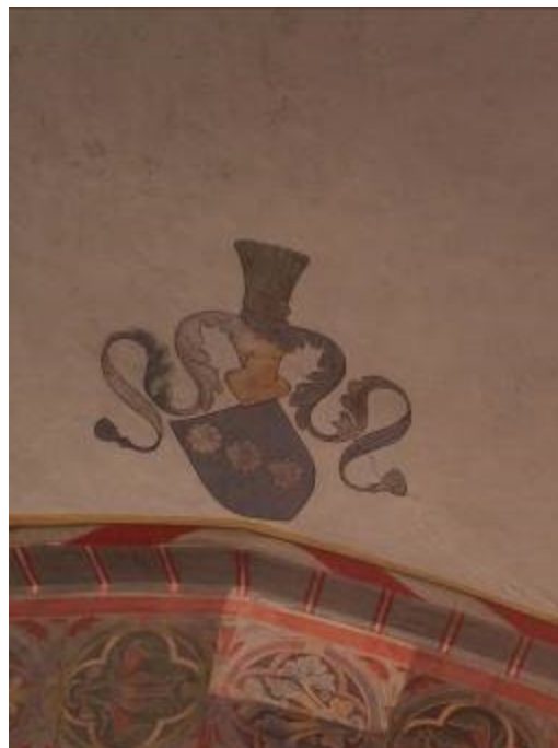
Våbener fra kirkens hvælvinger