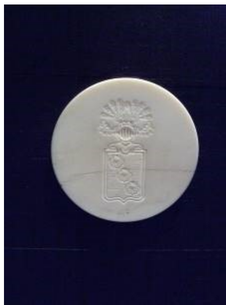
Et Gøjevåben i festsalen