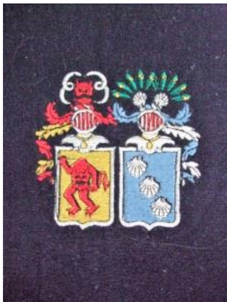
Broderede våbener på sovesalenes madrasser