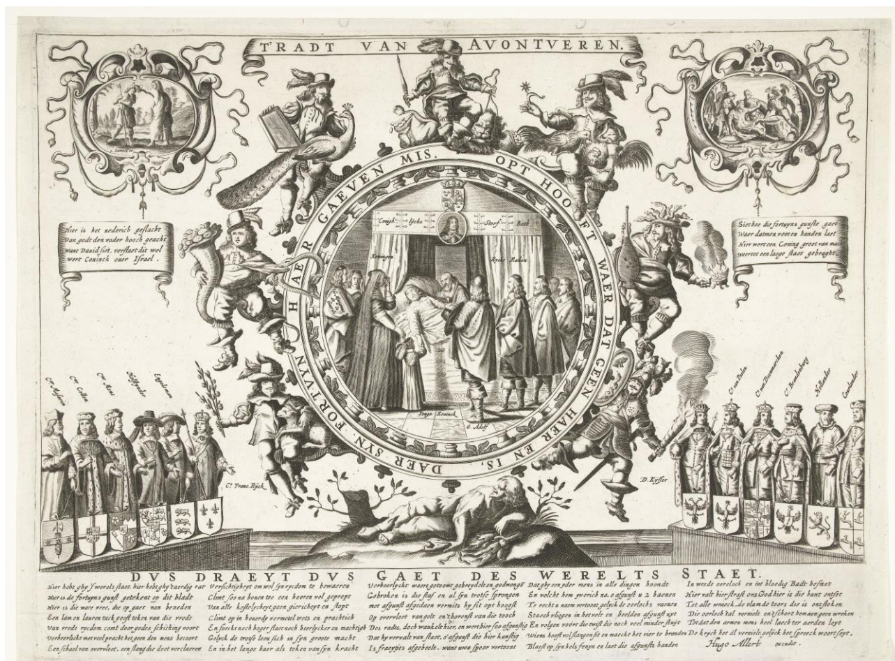
Anonym: Lyckans hjul vid konung Karl X:s död

Symposium på Riddarhuset söndagen den 15 oktober 2017