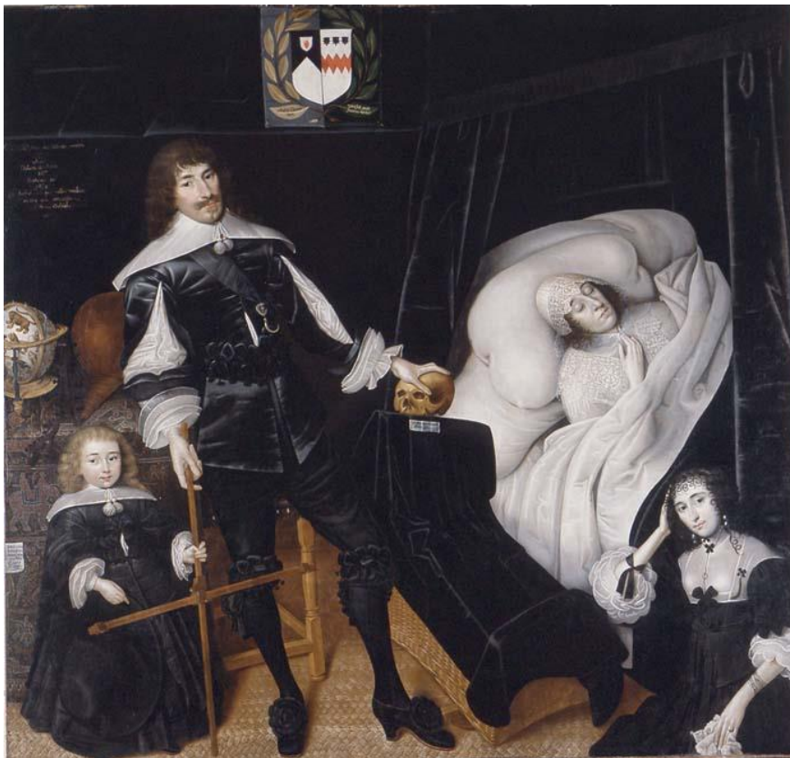
John Souch (1635): Sir Thomas Aston vid sin hustrus dödsbädd