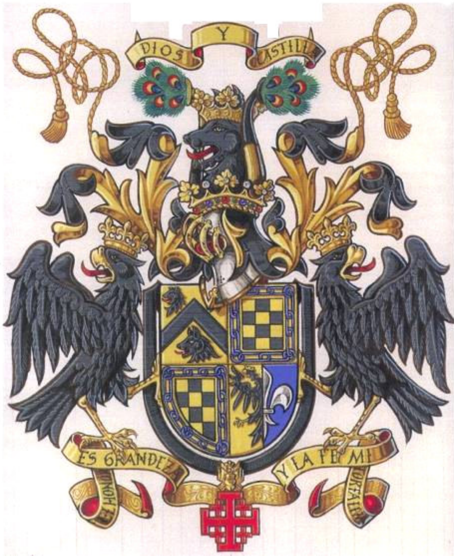
Alexander Scheel-Exner-Bermúdez' våben malet af Andrew Stewart Jamieson

Våbenet, der her er malet af den fremragende engelske kunster, Andrew Stewart Jamieson, indeholder følgende våbenmærker: 1. felt: Exner, 2. og 3. felt: Bermúdez og 4. felt: Scheel. Andrew S. Jamiesons hjemmeside kan ses her: