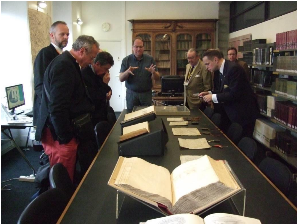
Særfremvisning på manuskriptafdelingen i Arras bibliotek