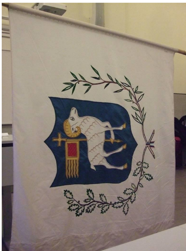
Gotlands nations fana, broderad av Hanna Bäckström