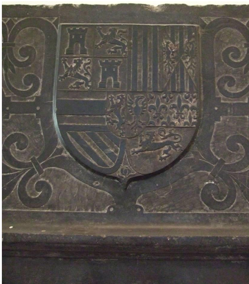
Våbenet for ærkehertug Albert af Arras (1574) fra en kamin i l'abbaye Saint-Vaast