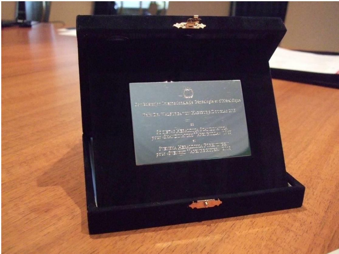
Plakettens text är identisk med den på diplomet