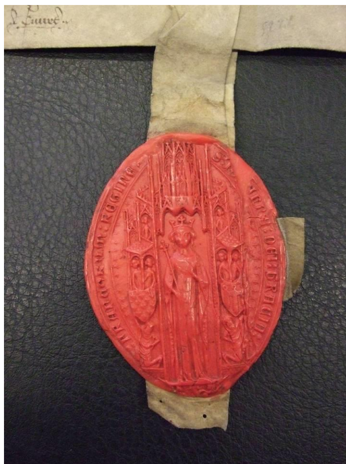
Segl for Jeanne de Boulogne, hertuginde af Berry