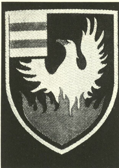
1. Sorø Akademis våben, fastsat 1960: I blåt felt en guld Fugl Fønixs med rødt næb, stigende op af røde flammer; en kanton af Oldenburg. Våbenet er bl. a. fremstillet i vævning til brug for skolens uniformer. Det viste våben er beregnet til anbringelse på brystet af en blazer og er 10 cm højt.

Fuglen Fønixs er en ældgammel figur, langt ældre end heraldikken. Den omtales lidt forskelligt i det gamle Ægypten, i Bibelen og Talmud, hos grækere og romere, og hos arabere. Om dens udseende skriver Herodot: »Jeg har aldrig set én selv, undtagen på et billede. Hvis billedet lignede, er dens