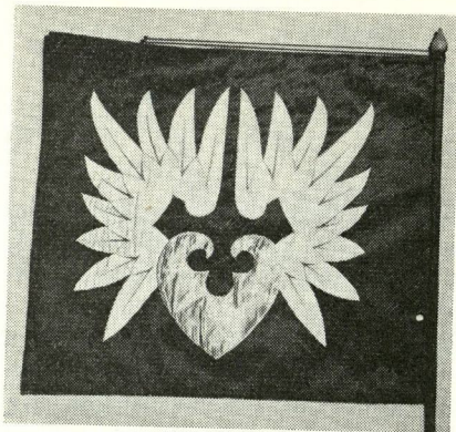
Gustaf von Numers: Närpes kommunfana. Fält är rött, sjöblad gul, och vingarna vita.

system av örnmärken för identifiering av sina djur. Detta system med sina märken och klara, kortfattade terminologi kan förliknas vid heraldik.