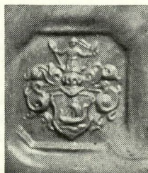
2. Avtryck av Gunnar Naucklér s vapenring, 1962. Här saknas skeppets »besättning» och »passagerare».

som med en lång åra styr sitt skepp fram över vattnet, medan en annan person i skeppets för synes syssla med seglet; ovan-