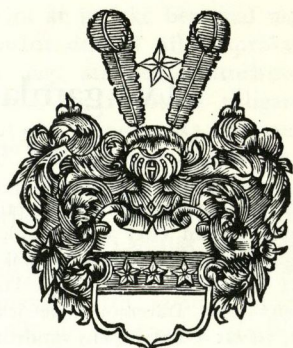
4. Träsnitt av von Warner(n)ska vapnet. Efter Muschards »Denkmal der uhraltten, berühmten, hochadelichen Geschlechter...», 1708.

ovanpå hjälmen ses också en stjärna (figur 3). Varifrån fick kapten Hohenthal idén till detta sitt vapen?