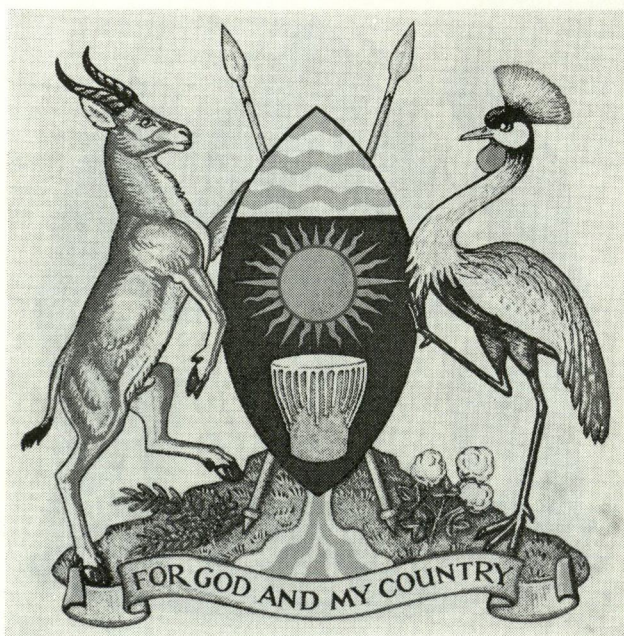
Uganda. Skjoldhoved: bølget af blåt og sølv. Hovedfelt: sort, med guld sol og guld eller naturligt farvet tromme. Dexter skjoldholder: muligvis en grantgazelle, sinister: en krontrane. På fodstykket: en kaffekvist (?) med bær og en bomuldskvist med hvide blomster.

Om det symbolske indhold i Tanganyikas og Ugandas våbener kan jeg ikke oplyse andet, end hvad enhver selv kan slutte sig til. Krontranen var