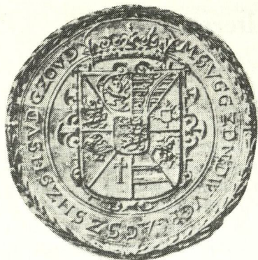
2. Segl efter et signet ført af Magdalena Sibylla i hendes egenskab af dansk prinsesse. Hun blev gift med prins Christian i 1634. Efter Grandjean: Danske kongelige Segl . . ., 1951.