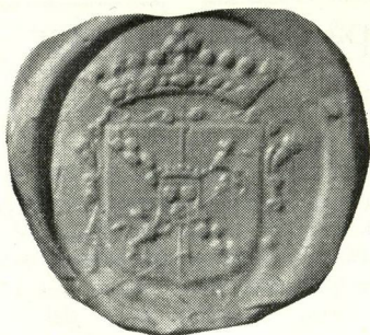
2. Segl tilh. baron Axel Rosenkrantz av Rosendal 1700. Feltenes orden er her som i det vanlige Rosenkrantz-våben, og ikke som angitt av Storck o. a. Seglet noget forstørret.

ben er feltenes orden omvendt: skaktavlbjelken — dextervendt — i 1. og 4. felt, løven i 2. og 3. felt (bortsett fra ved heraldisk kurtoasi, sml. HT 5/210 og 211). Dette er dog ikke tilfelle i det våben, som i 1678 blev tildelt en norsk gren av familien, baron Rosenkrantz av Rosendal, i hvilket feltenes orden er som i seglet.