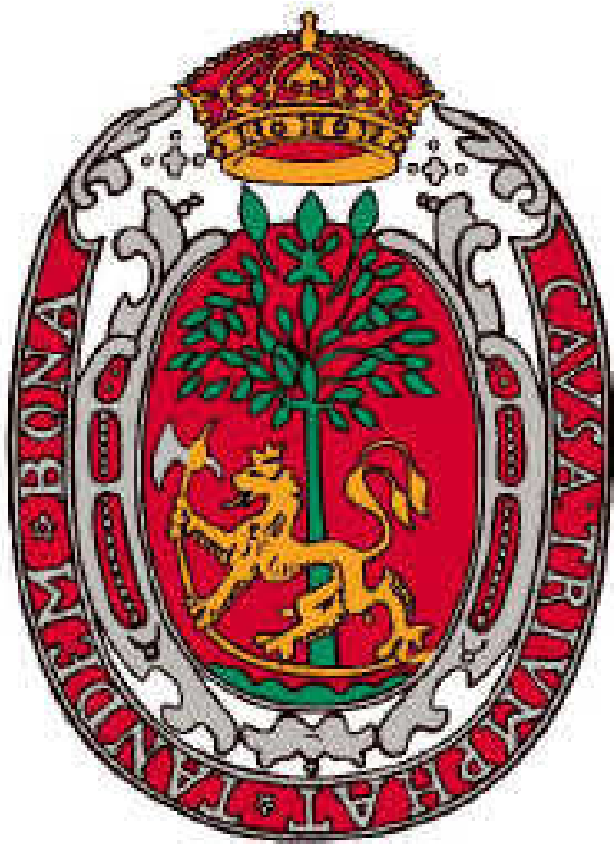
Kristiansands nuværende våben. Gengivet med tilladelse.