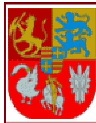
Hertugvåbenet i en større gengivelse.