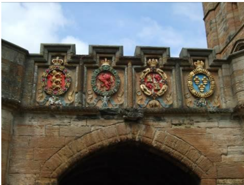
Linlithgow Palace, ytterporten med vapnen för de fyra riddarordnar som James V tillhörde: Strumpebandsorden, Tistelorden, Gyllene Skinnets och St.Michaels orden.