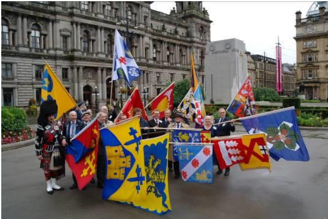
Fanborg utanför City Chambers