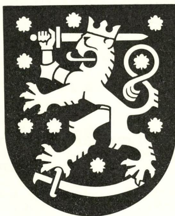
3. En modär version av uppsalavapnet. Komponerad av heraldikern Ahti Hammar, Helsingfors.

ursprungligen fyllnadsfigurer, men då folkopinionen i dem ser de nio historiska landskapen i Finland, måste antalet bibehållas konstant. Ehuru ingendera av ovan anförda blasoneringsalternativ fyller de heraldiska kraven, torde dock det förstnämnda lämpa sig bättre i en arbetsinstruktion för vapenkonstnärer. Dessutom må man observera, att åtminstone i nordisk heraldik, regeln om strödda småfigurer i fältet, aldrig strängt genomförts 10) . Angivandet av antalet rosor uppenbarar avsikten att alla är helt synliga.