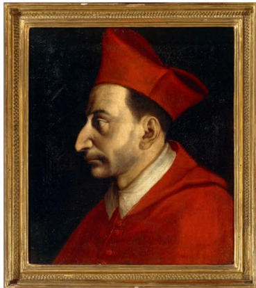
Den pavelige legat i Bologna, kardinal Carlo Borromeo (1538–1584)